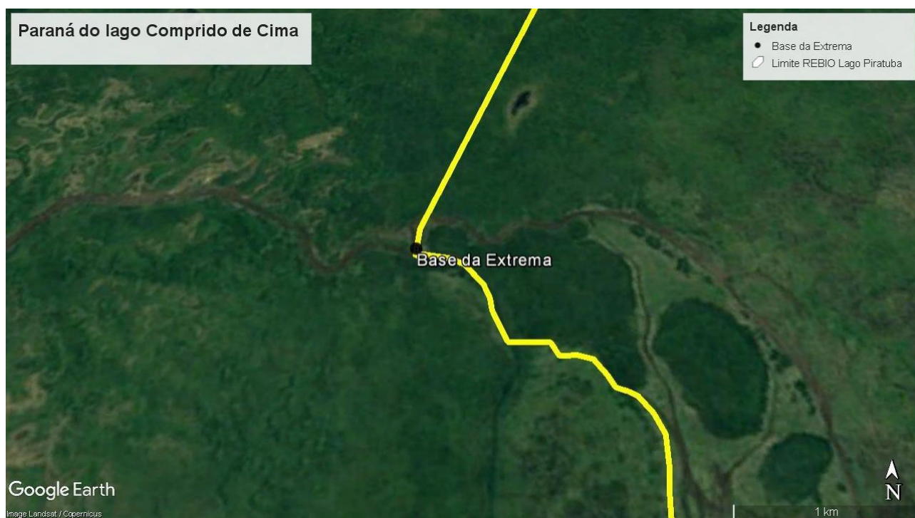
Figura 01. Localiza o da Base da Extrema e do Paran  do Comprido de Cima

Trata-se de uma barreira f sica a ser instalada nos dois canais de acesso do paran  do lago Comprido de Cima a fim de impedir o acesso de qualquer tipo de embarca o. As embarca es s  poder o trafegar mediante abertura de port o de acesso pelo Instituto Chico Mendes. Portanto,   uma barreira fluvial e que deve acompanhar a varia o anual do n vel de  gua, as velocidades do fluxo h drico e a largura dos canais ao longo do ano.